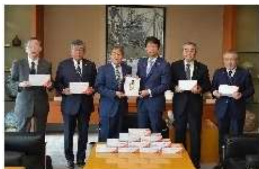
贈呈式 10/14 茨城県庁知事公室にて